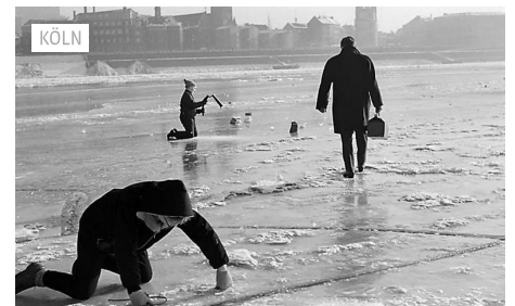
Historische Winter: Als man auf dem Kölner Rhein...