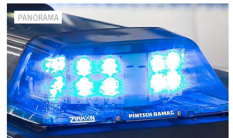
Verdacht auf Kidnapping: Teenager stehlen Auto mit...