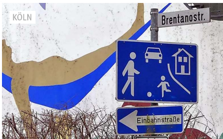
Stadtspaziergang Neuhrenfeld: Auf verschlungenen...