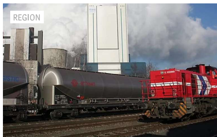
Rhein-Erft-Kreis: Stadtbahnlinie von Köln über Pulheim...