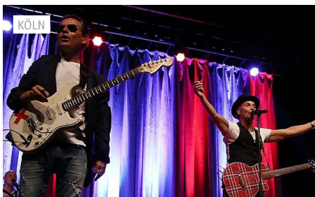
Karneval: Das sind trotz Corona die beliebtesten...